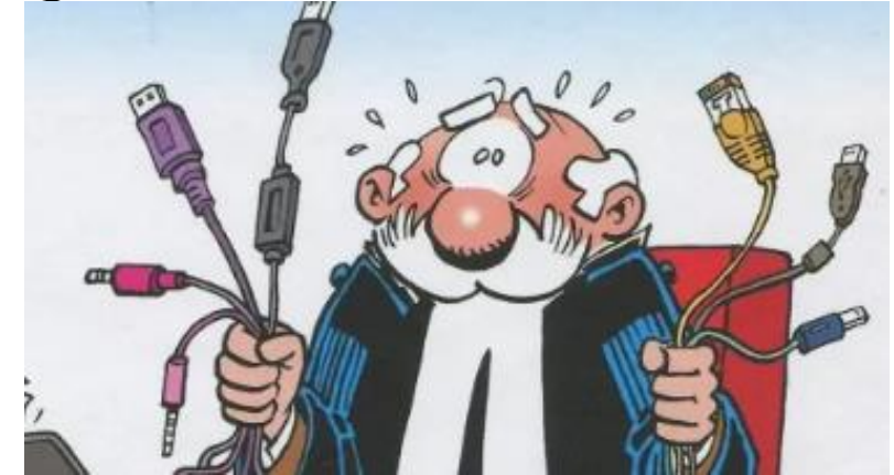
Plaatje uit stripverhaal "De rechter is de draad kwijt"